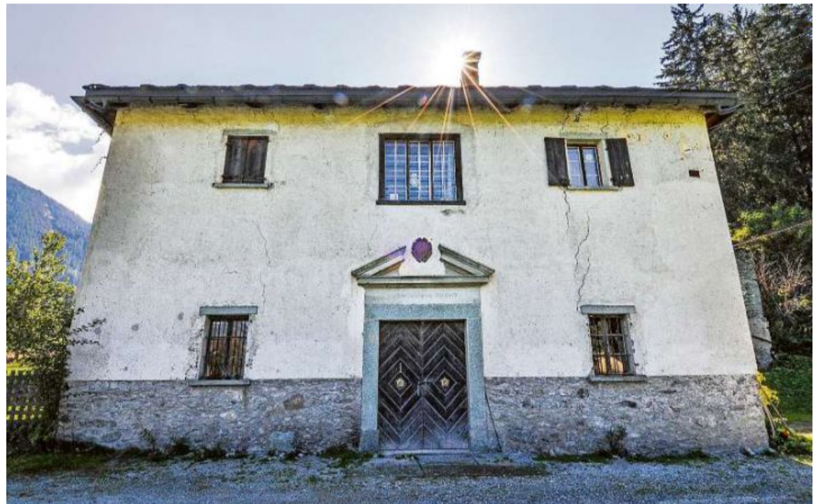
Keine Fiktion: Das Haus Rosales mit dem historischen Blashochofen existiert tatsächlich – in «Tod in Andeer» spielt es eine wichtige Rolle.

Doch wie immer in Juon-Krimis: Nicht nur die offiziellen Ermittler sind am Werk, auch Leute aus dem Dorf spüren der Unbekannten nach. Allen voran Senior-