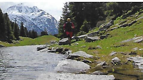
In Kürze notiert