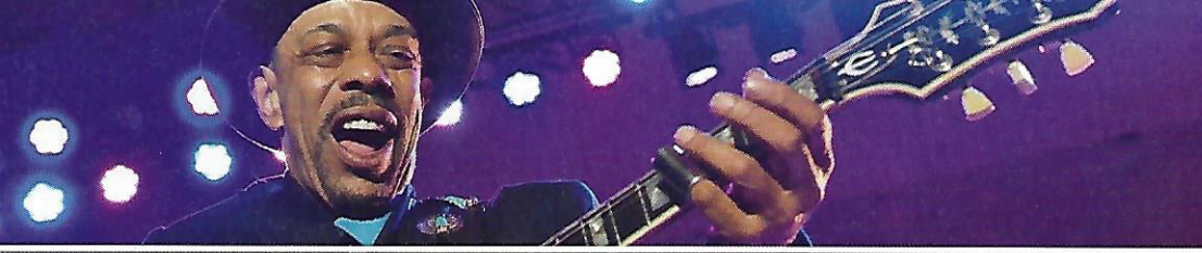
Blues & Rock Night in der Karbidhalle